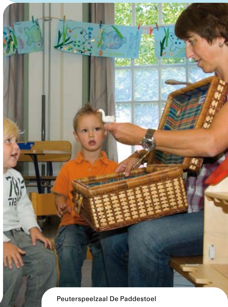
Peuterspeelzaal De Paddestoel

In de periode van 2003 tot en met 2006 volgden de leidsters van peuterspeelzaal De Paddestoel, Het Duikelaartje, De Ukkepekken en de leerkrachten van de groepen 1 en 2 van basisschool De Radonkel de driejarige cursus Startblokken van Basisontwikkeling. Samen kozen zij bewust voor het werken volgens deze visie waarbij vooral het werken vanuit betekenisvolle thema's hen in eerste instantie aantrok. Een ander belangrijk doel was daarbij te komen tot een doorgaande lijn van peuterspeelzaal naar groep 1-2 van de basisschool. Inmiddels zijn alle leidsters en leerkrachten gecertificeerd en hebben hiermee de basis cursus Startblokken van Basisontwikkeling succesvol afgerond!